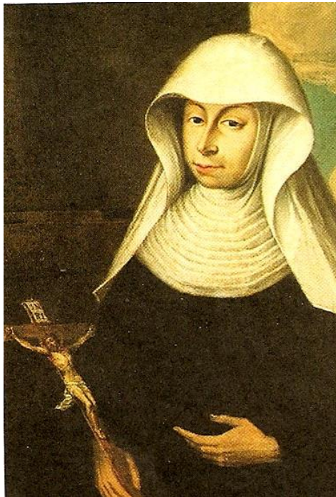
Heilige Crescentia (20.10.1682-5.4.1744 †)

Am Sonntag 24.09.17 fahren wir von Ottobeuren mit dem Bus um 12:04 Uhr oder 15:04 Uhr nach Memmingen HBF, von hier sind alle Zielbahnhöfe erreichbar. Hier geht es dann um 13:07 Uhr oder 16:05 Uhr von Memmingen HBF weiter per Zug über Mindelheim Buchloe nach Geltendorf und München. Ankunft in Geltendorf 14:37 Uhr oder 17:07 Uhr .