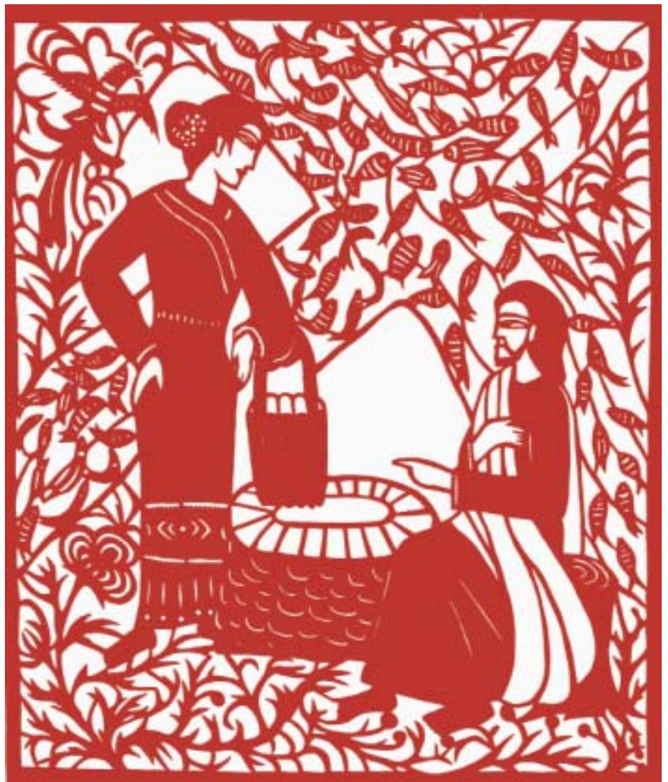
Links: Jesus fordert den Zöllner Zachäus auf, vom Baum herunterzusteigen und ihn aufzunehmen.