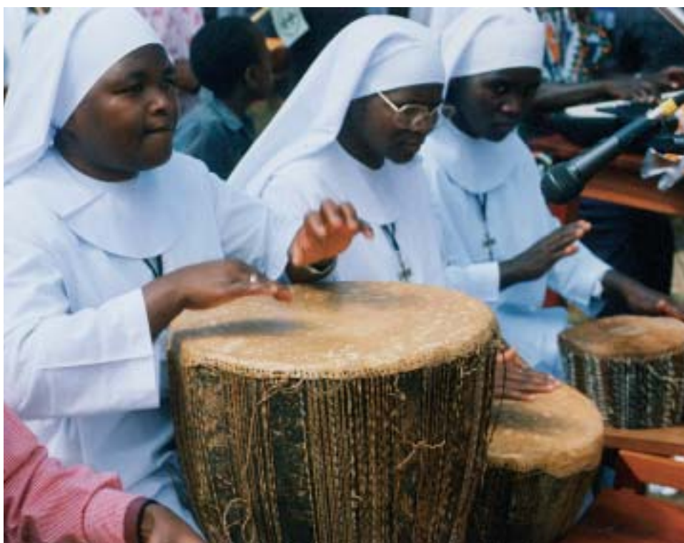
Links: Überall wirken sie bescheiden im Hintergrund mit. Bei der Gestaltung des Gottesdienstes...

... aber auch bei der Krankenversorgung, in Schreinerei und Schmiede stehen sie ihren Mann.