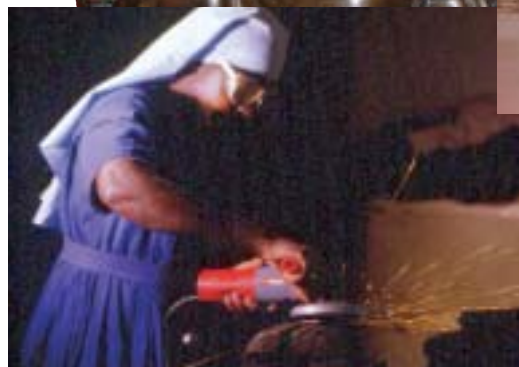
Schwwestern stehen überall ihren Mann Seite 9