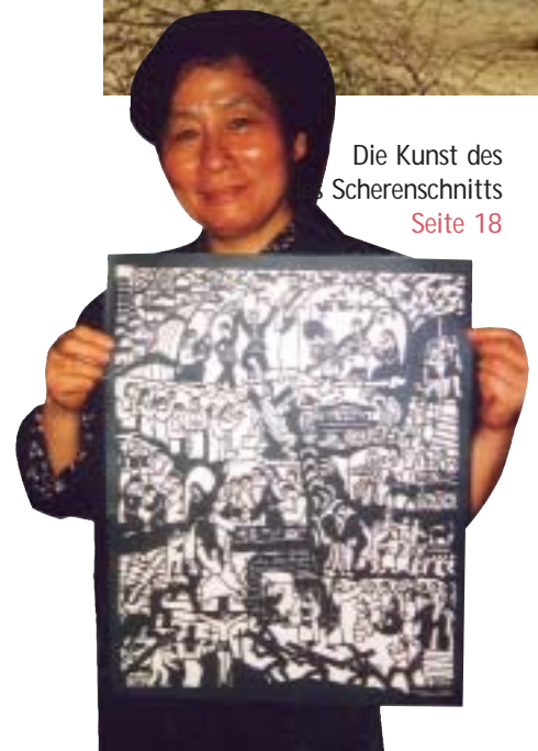
Die Kunst des Scherenschnitts Seite 18