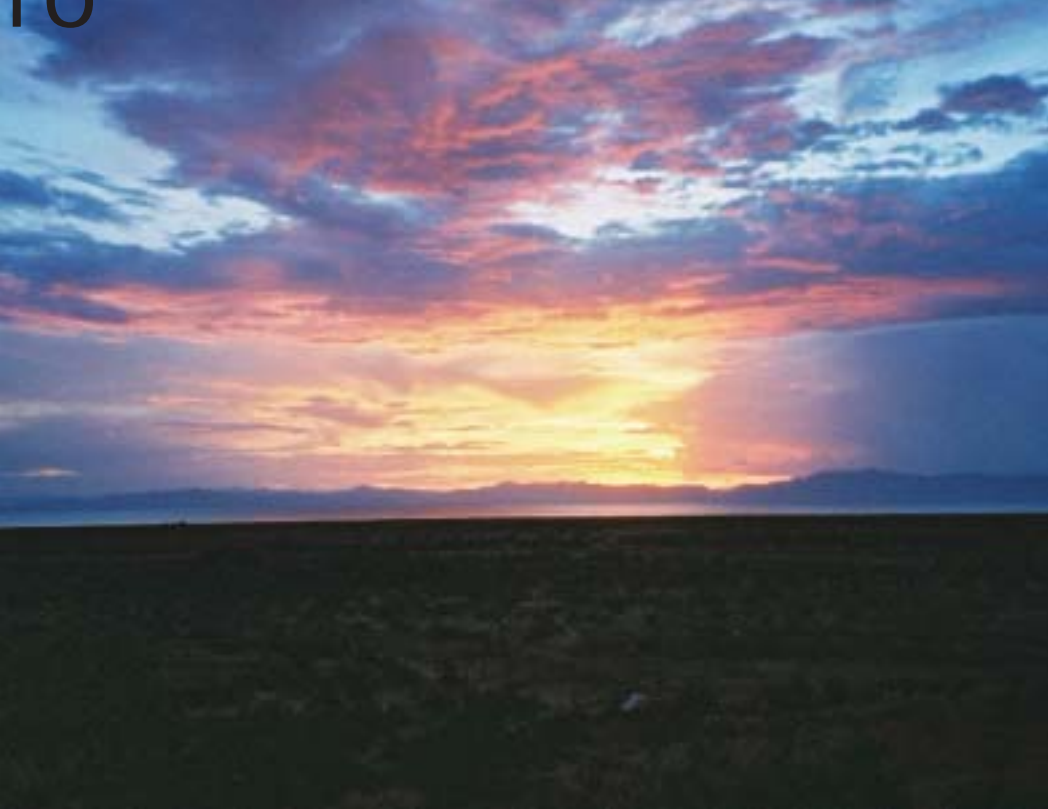
Oben: Sonnenuntergang in der Wüste. Darunter: gekocht wird auf einer Propangasflasche. Ganz unten: beim Sonntagsgottesdienst.

hier ständig von seiner eigentlichen Arbeit abgehalten wurde. Ich kann das gut verstehen. Da es keine Krankenstation gibt, kommen die Leute jetzt ständig zu mir. Für normale Krankheiten wie Malaria, Durchfall, Würmer und Wunden bin ich auch ganz gut mit Medikamenten ausgerüstet. Für größere Krankheiten müssen die Leute nach North Horr reisen, oder sie leben einfach mit ihrer Krankheit.