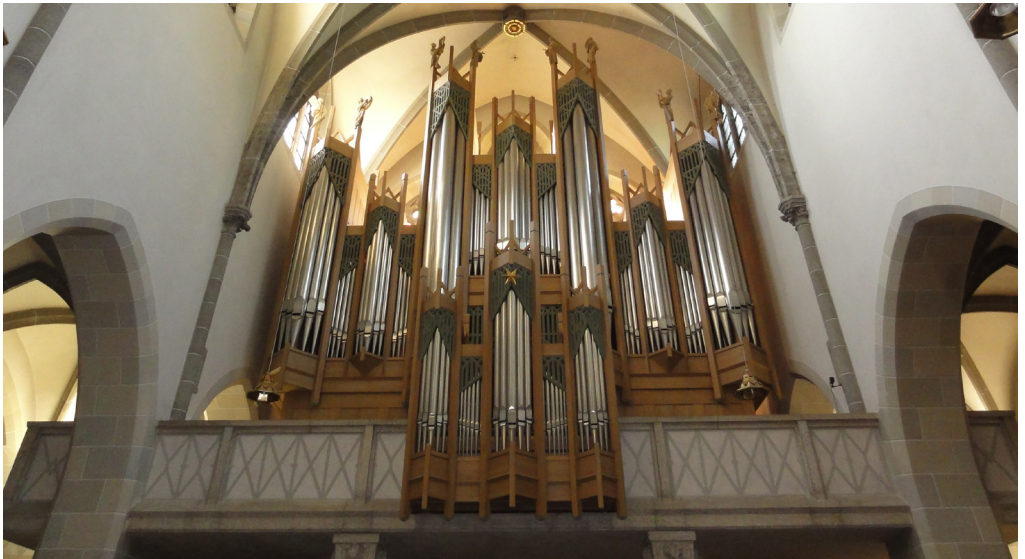
Hauptorgel in St. Ottilien