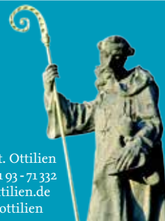
Stiftung Erzabtei St. Ottilien

Erzabtei St. Ottilien • 86941 St. Ottilien Telefon: 0 81 93 - 71 0 • Fax: 0 81 93 - 71 332 kontakt@ottilien.de • www.ottilien.de f www.facebook.com/sankt.ottilien