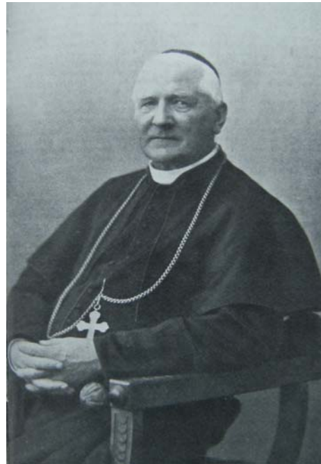
Cardinalis Miecislaus Ledóchowski