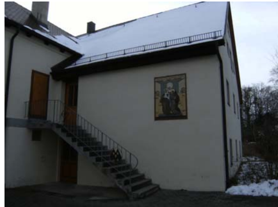
Aedificium «Sanctae Annae».

In initio sorores parte occidentali castelli Ambingensis usae sunt, ubi pedepianis culina atque cenatio sitae erant, in primo tabulato sororum oecus communis, conclave superiorissae, conclave aegrotis destinatum atque similia erant, et in tabulato subteglaneo sororum oecus dormitorium inveniebatur. Condicio quidem erat melior quam Richopagi, sed iam paulo post iterum angustiae quaedam animadvertebantur, cum numerus sororum continuo augetur. In fine anni 1888 i videntur iam triginta sex sorores candidataeque adfuisse. 29