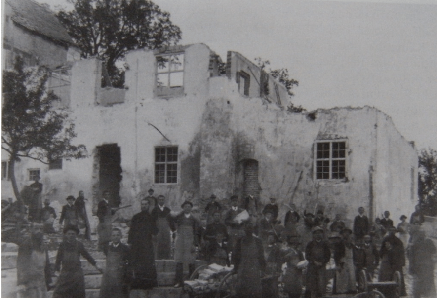
Vetus Ambingense castellum diruitur. [Maria HILDEBRANDT (2008), p. 13.]

Alterā ex parte confratribus suis Ottilianis de sequelis severis huius colloquii cum episcopo habiti nihil rettulit, sed domum reversus solum de bono effectū consultationis narravit. 105 Insuper - quod similiter mirum est - P. Andreas