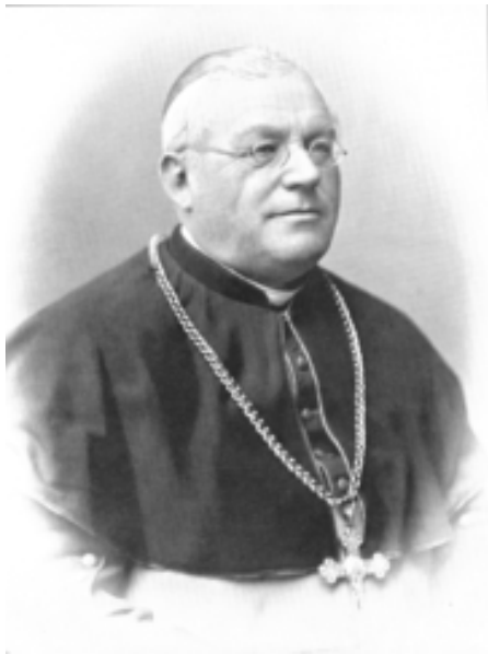
Petrus von Hötzl, episcopus Augustanus. [Imago ex archivo Otiliensi deprompta.]

Colloquium autem, quod P. Andreas Amrhein die 11 o m. Sept. a. 1894 o cum episcopo Augustano habuit, erat ultimum, quod inter ipsos institutum erat. Nam die 8 o m. Oct. a. 1894 o Pancratius von Dinkel, qui semper fautor be-